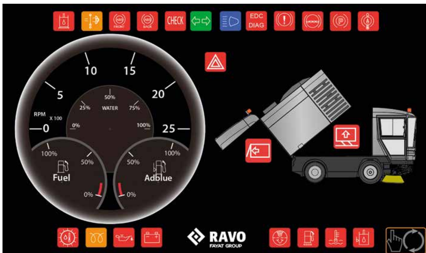
Hoofdscherm (machine in kipstand)

alle gegevens weer over de prestaties van de veegmachine, detecteert fouten in het functioneren van het systeem en waarschuwt wanneer onderhoud aan de machine nodig is. Zodra de machinist de werkmodus van de machine verandert van vegen naar rijden of kippen, past het iSystem de informatie op het scherm aan. Zo heeft de machinist altijd de beschikking over de juiste gegevens voor optimale controle over de machine.